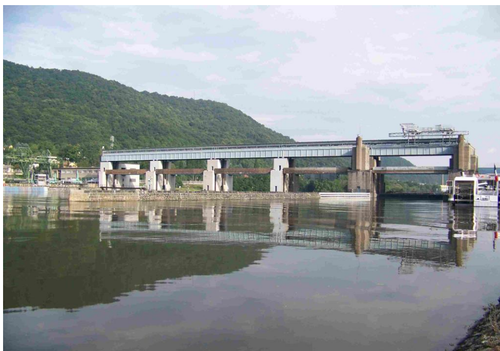
Pohled na jez z horní vody

Jez byl postaven v letech 1924 - 1936. Je zatím posledním plavebním stupněm na labské vodní cestě. Vzhledem ke geologickým poměrům bylo nutno celé vodní dílo založit na kesonech. Čtyři jezová pole hrazená dvojími tabulovými uzávěry typu Stoney mají světlou šířku 24 m. Hlavním účelem díla je zajištění plavebních hloubek v úseku Lovosice-Střekov. Další využití je energetické, zajištění podmínek pro odběry povrchové vody a rekreaci. Poměrně značný rozsah provozní hladiny umožňuje i krátkodobé nadlepšení průtoků pod VD a tím i zabezpečení vodního stavu na regulované části Labe v úseku Střekov-Děčín.