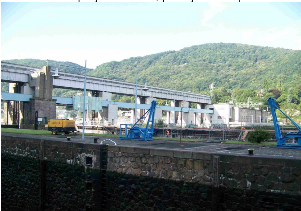
Umístění veřejné jezové lávky a lávky strojoven

Krytá manipulační lávka je umístěna na vrcholu jezových pilířů a pne se přes všechna jezová pole a velkou plavební komoru. Přístupná je schodišti ve 3 pilířích jezu. Boční plnostěnné ocelové nosníky